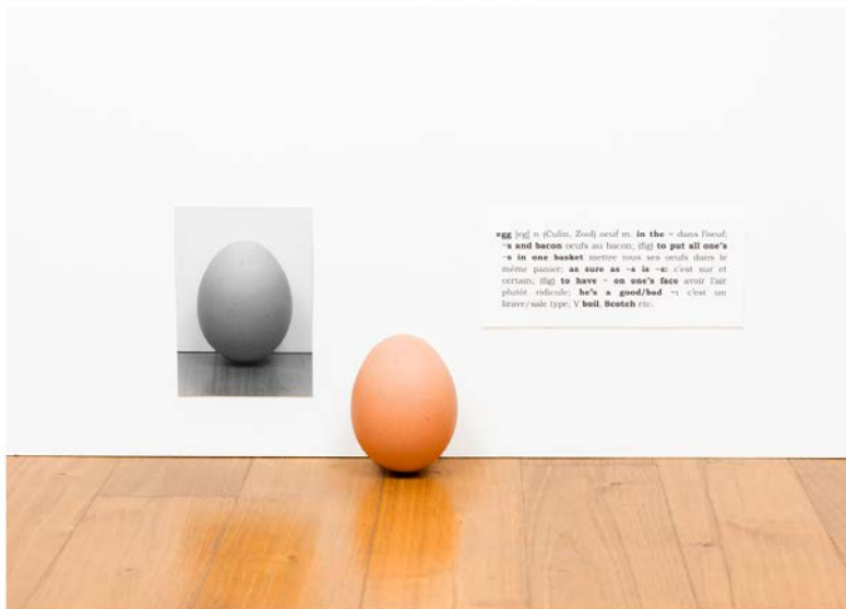
pour Joseph Kosuth

http://www.barthesamaral.com/gallery1.html