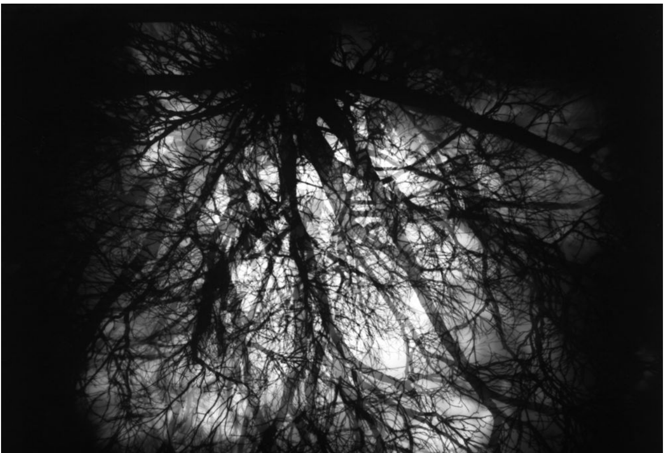
Sténopé, Sans titre, 2016

Exposition du 18 octobre au 17 novembre 2016 à la Halle Dardé