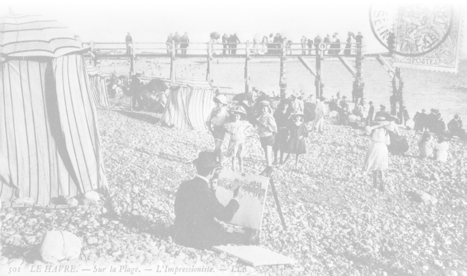
501 LE HAVRE. — Sur la Plage. — L'Impressioniste. — LLA