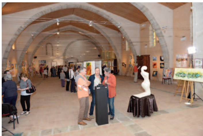
Chapelle Saint-Martin du Barry à Montperoux - exposition 2015