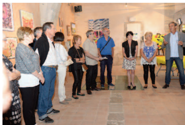
Les autorités et les artistes le jour du vernissage le 12 juin 2015