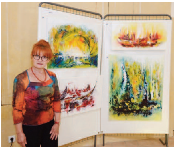
1er prix du public - NATELL