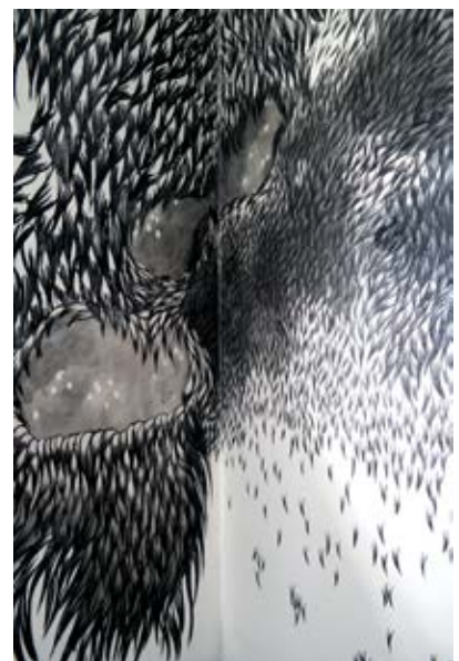
extrait, dessin mural au fusain - 2015