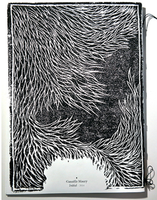
Initial , livret, 9p, gravures sur polystyrène - 2015

Michel Guérin – Philosophie du geste, Actes Sud, 2011