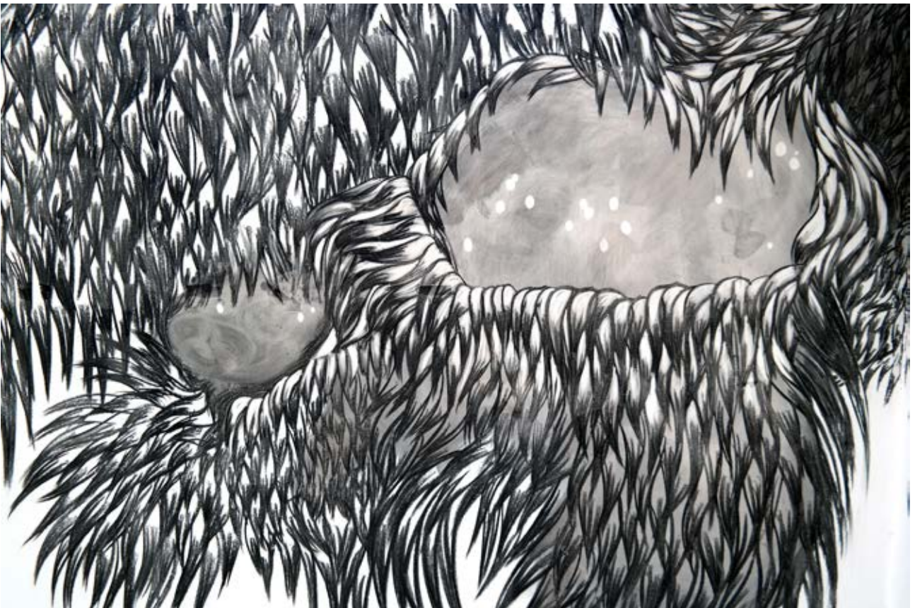
extrait, dessin mural au fusain - 2015