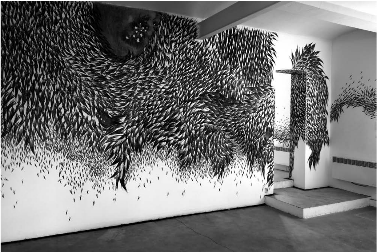
extrait, dessin mural au fusain - 2015