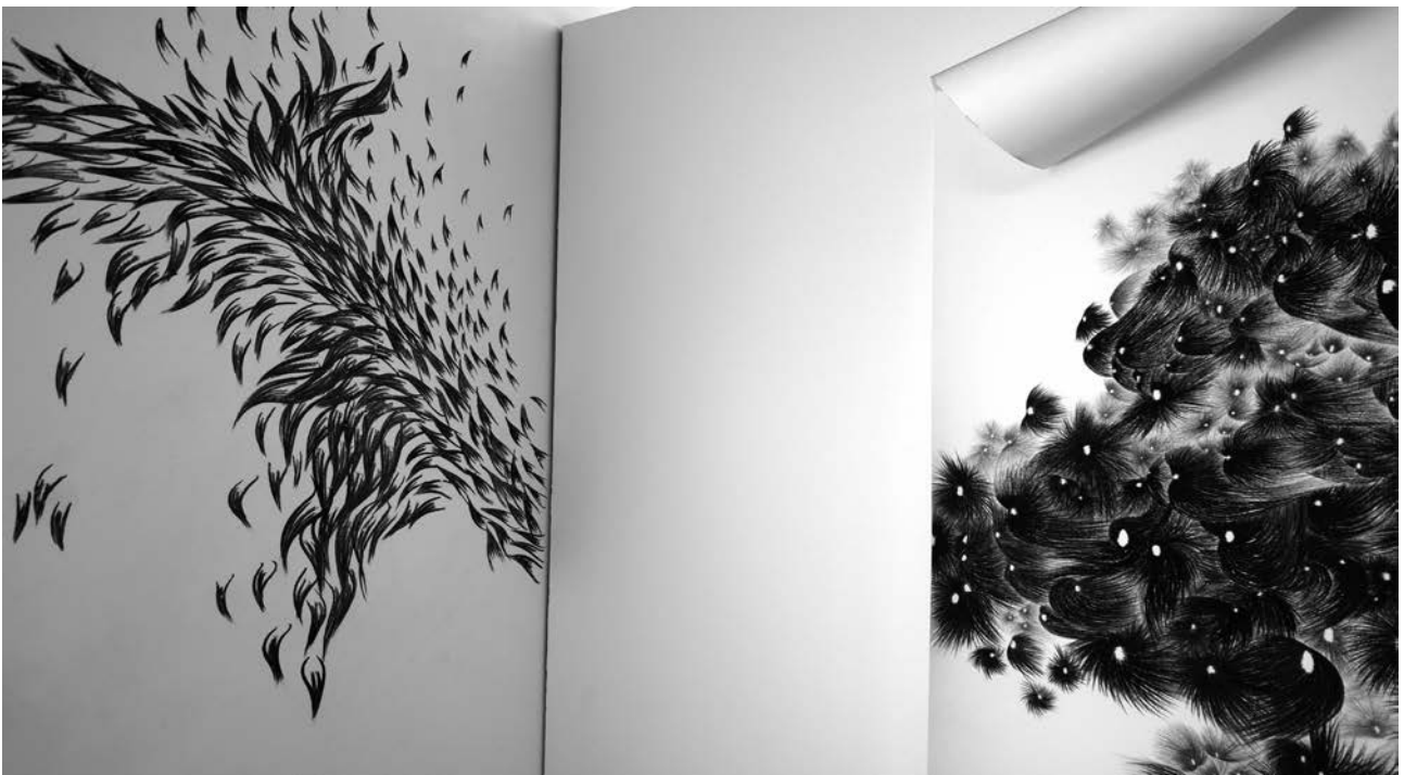
extrait, à gauche, dessin mural au fusain / à droite Nocturne , dessin au fusain sur papier - 2014/2015

PLANET CARAVAN, enveloppe les volumes architecturaux et compose un objet immersif qui invite les visiteurs à traverser l'œuvre en s'interrogeant sur le geste.