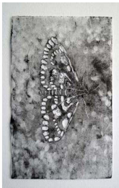
extrait, Papillons de nuits , gravures sur polystyrène -2015