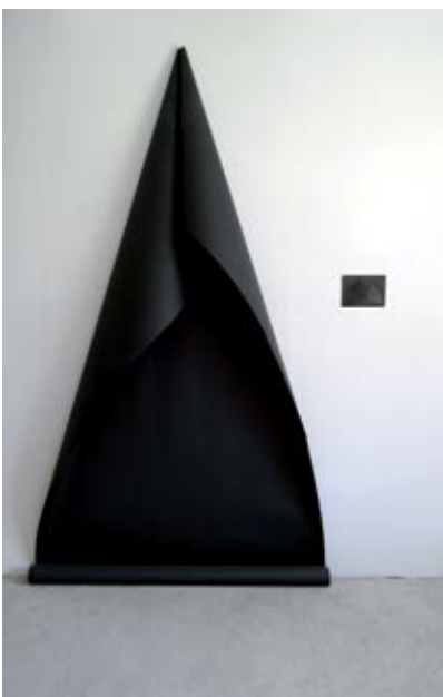
installation, Papier noir & dessin - 2015