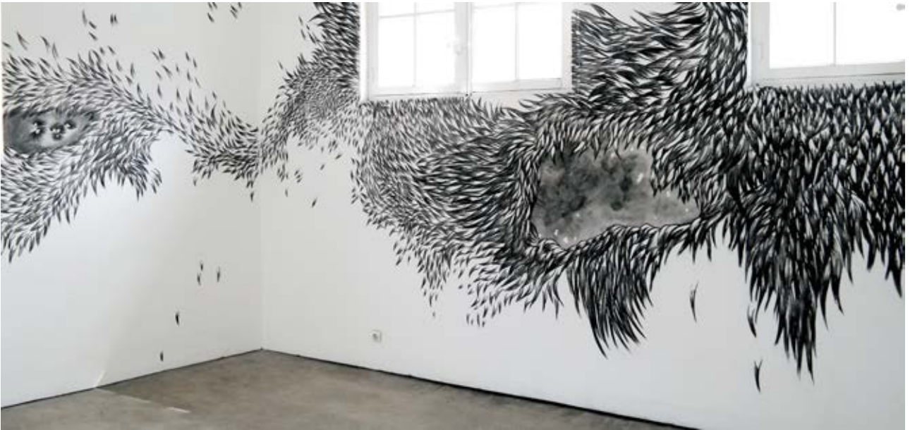
extrait, dessin mural au fusain - 2015