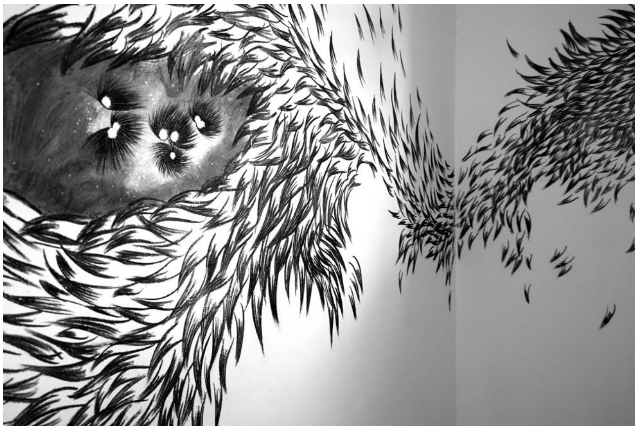
Extrait, dessin mural, fusain, 2015