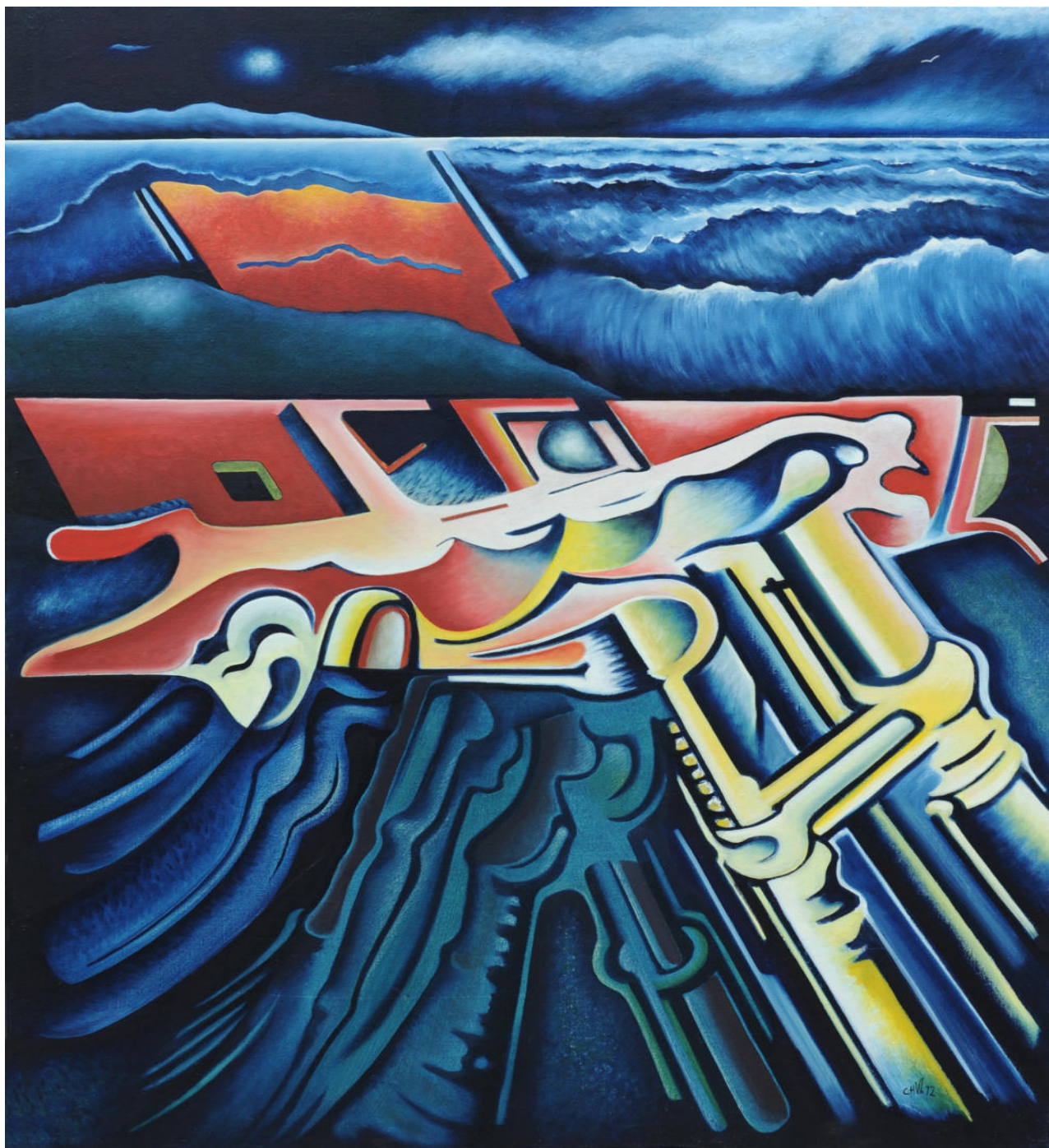
Voyage à faire et à refaire Huile sur toile -117x90cm - 2012

Ce n'est pas un bleu, c'est un éloignement.