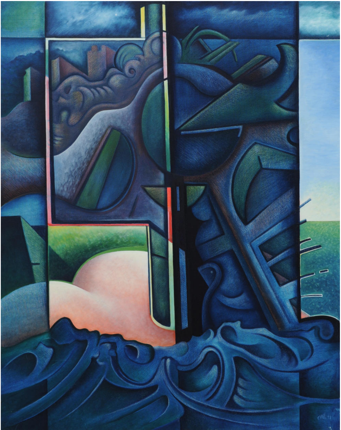
Trésor protégé accessible Huile sur toile -117x90cm - 2012

La peinture vous oblige à vous souvenir. Elle propose au regard des paysages, ceux des rêves, des sentiments et des constats.