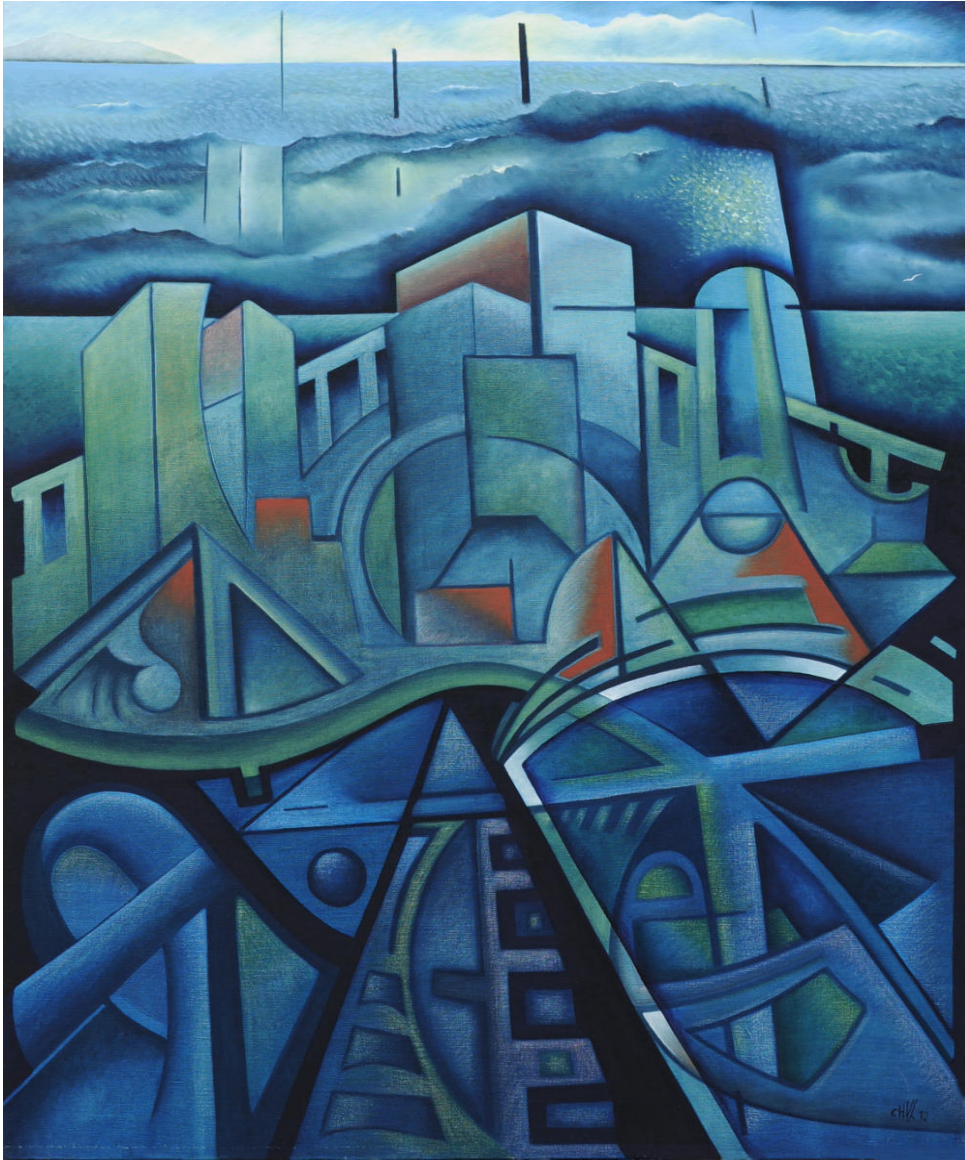
Le jour se lève, il faut tenter de vivre Huile sur toile - 117x90cm - 2012