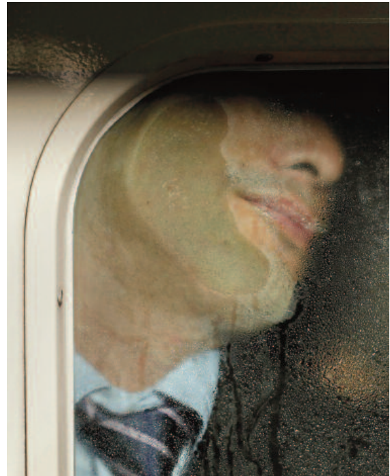
Tokyo Compression 5 Michael Wolf