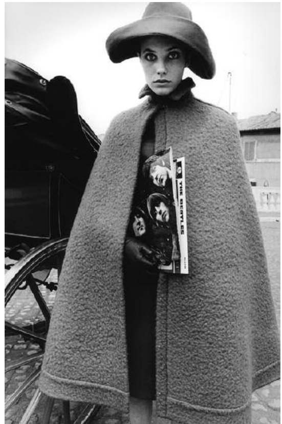
Jane Birkin pour Harper's Bazaar. Rome, 1966