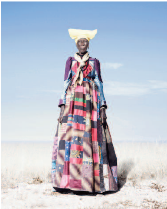
Femme Héréro en robe patchwork, 2012. © Jim Naughten

Les anciens combattants aiment les médailles et les uniformes. En plein désert namibien, les Héréros ont leur façon à eux de commémorer le soulèvement de leurs ancêtres contre l'opresseur allemand, en 1904. Ils portent les vêtements des anciens colons et exorcisent ainsi les rites violents de l'occupant. Sur fond de nulle part, dans une brume de chaleur et un silence incandescent, l'Anglais Jim Naughten a photographié la tribu Héréro revêtue de singuliers costumes : robes longues à manches bouffantes pour les femmes, uniformes prussiens, brandebourgs et ceinturons pour les hommes... Vêtements surréalistes échappés d'une histoire sanglante.