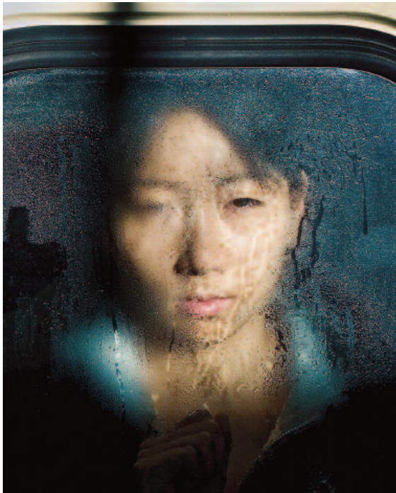
Tokyo Compression 18 Michael Wolf courtesy La Galerie Particulière / Galerie Foucher-Biousse, Paris

Michael Wolf est représenté par La Galerie Particulière / Galerie Foucher-Biousse, Paris.