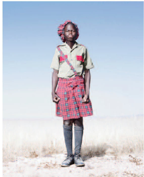
Cadet Héréro en kilt, 2012.