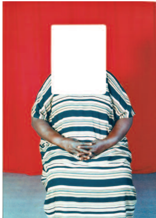
Photo retrouvée au Gulu Real Art Studio Courtesy Galerie Camilla Grimaldi, Londres