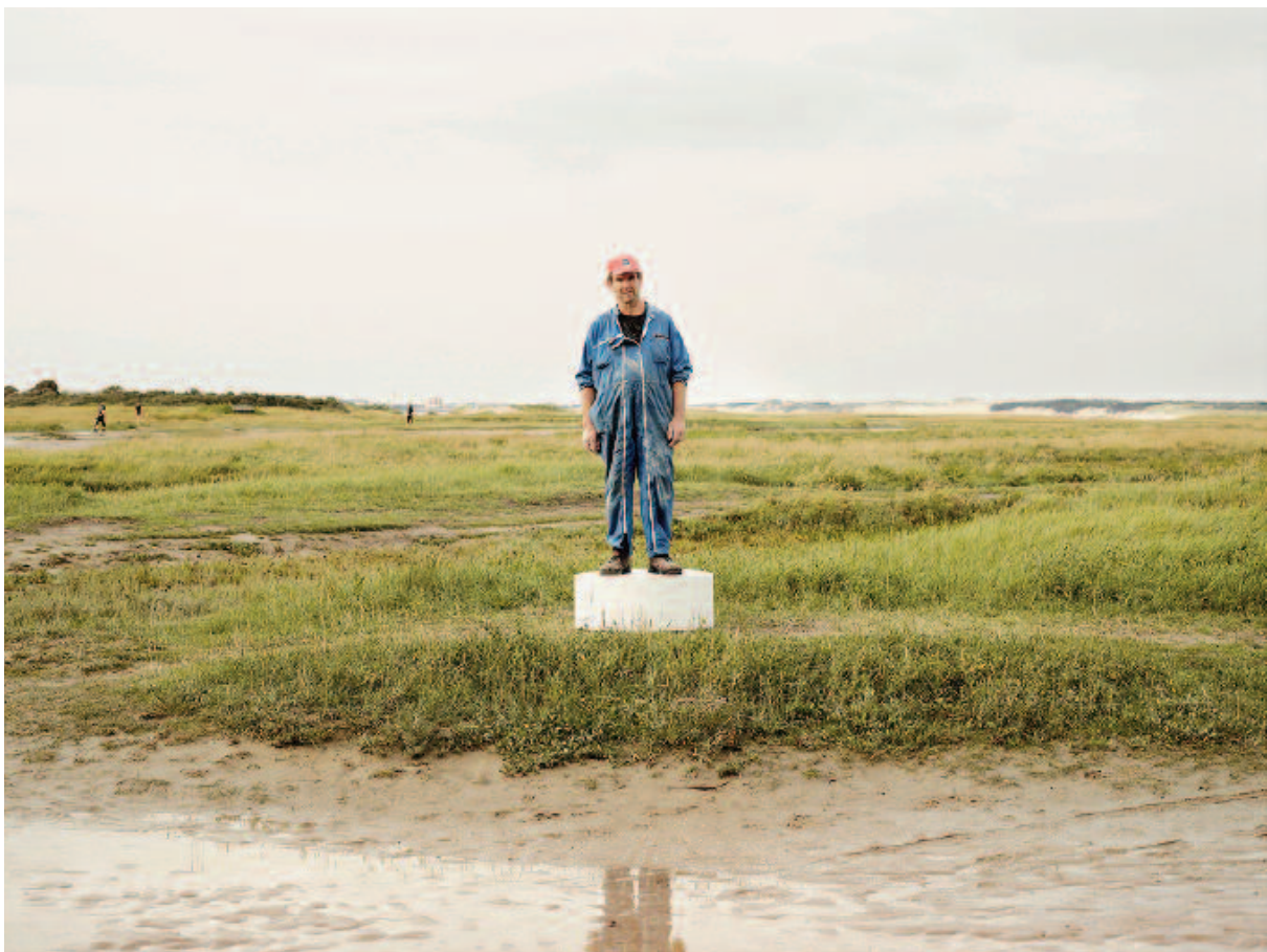
Série "Echelle 1"

Que se passe-t-il lorsque l'on pose un socle au beau milieu de l'espace public et que l'on demande aux passants de monter dessus ? Le socle est le premier pas vers le piédestal semble dire Cédric Delsaux qui a démarré depuis plusieurs années déjà une série baptisée « Echelle 1 » où il réenvisage les liens qui unissent les gens et les lieux dans lesquels ils évoluent chaque jour. A Vichy où il a mené une résidence au printemps dernier, le photographe a reconduit l'aventure et su persuader les Vichyssois, que chacun d'entre eux, le temps d'un portrait statufié, avait le droit de devenir l'emblème de sa ville, le héros de son quartier.