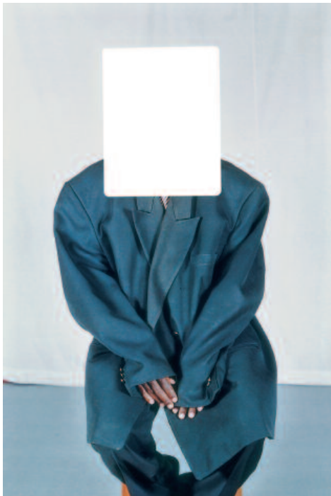
Photo retrouvée au Gulu Real Art Studio