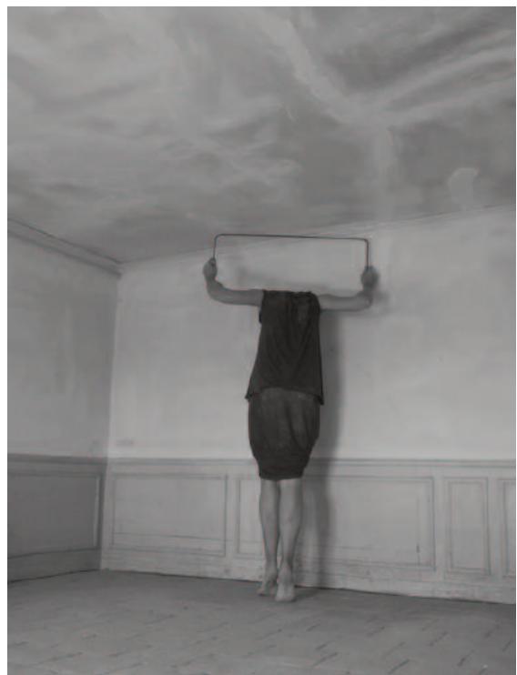
Série Tout contre © Claudia Huidobro