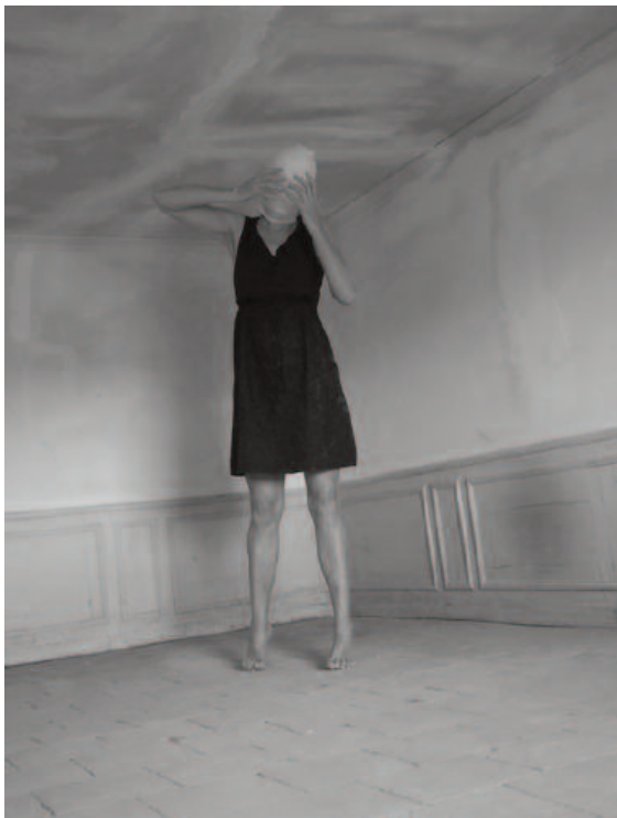
Série Tout contre

Une pièce située dans un château du sud de la France, quelques objets trouvés sur place et un appareil photo doté d'un retardateur, il n'en faut pas davantage à Claudia Huidobro pour construire une série dont sa grande silhouette est le pivot. Dans des volumes contraints, la photographe chilienne contraint son corps. Habile danseuse et contorsionniste, elle fait disparaître son visage pour ne plus être qu'une forme quasi abstraite qui se loge tant bien que mal sous les combles, géante qui s'affronte au vide, repousse les murs, tutoie les plafonds, bouscule le décor et d'une certaine façon, finit par l'appivoiser et ne plus faire qu'un avec lui.