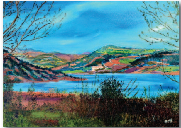
Maïté Rieubo Toeschi