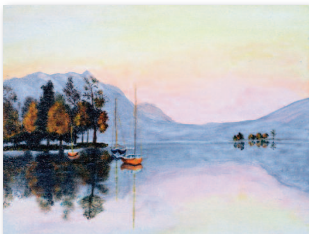
Evelyne Caron-Laviolette troisième prix des mairies