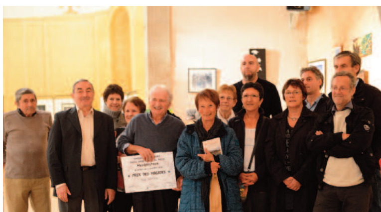
Le 2 novembre 2012 lors de la remise des prix les autorités et les lauréats