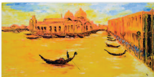
Jacqueline Gouley deuxième prix des mairies