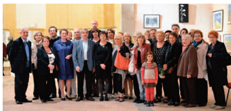
Les autorités et les artistes le jour du vernissage le 20 octobre 2012