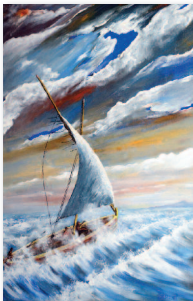
Pierre Bertuel premier prix des mairies