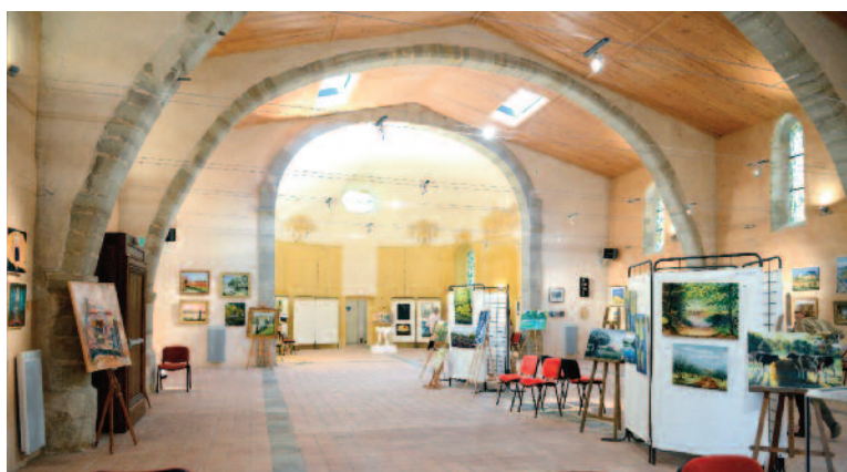
Chapelle Saint-Martin du Barry à Montperoux - exposition 2012