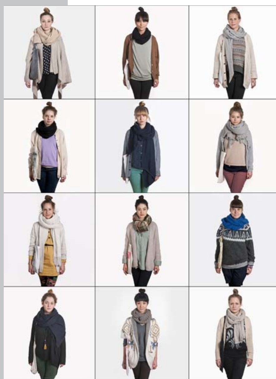
137. Veggies - Zürich 2012

Le reportage évoque la volonté d'entreprendre un voyage sur la Planète Rouge telle que prônée par plusieurs organisations et par une partie de la communauté scientifique.