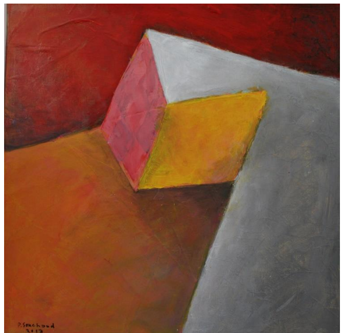
Tout là-haut, 2017

Technique mixte et collage acrylique sur toile, 116 x 89 cm