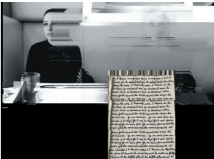
Extrait du livre-CD à paraître chez Actes Sud.

Digital After Love, que restera-t-il de nos amours ? fera également l'objet d'une édition sous la forme d'un livre-CD, dans la collection « Les Musicales » d'Actes Sud. Le livre paraîtra en novembre prochain pour l'exposition, et sera disponible en librairie en janvier 2019. D'un format de 13 x 18 centimètres, il comportera 64 pages dont une trentaine de photographies accompagnées de textes et de graphismes inspirés de SMS et messages de réseaux sociaux, ainsi qu'un CD réunissant les compositions musicales de Ruppert Pupkin.